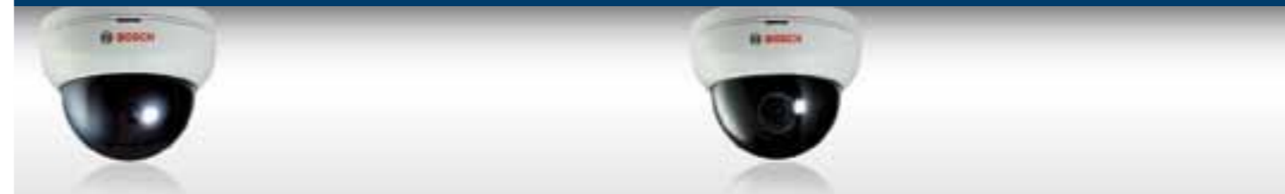
VDC-250F04-10 Câmera dome de lente fixa D/N, lente fixa de 3,8 mm, CCD de 1/3 pol., PAL