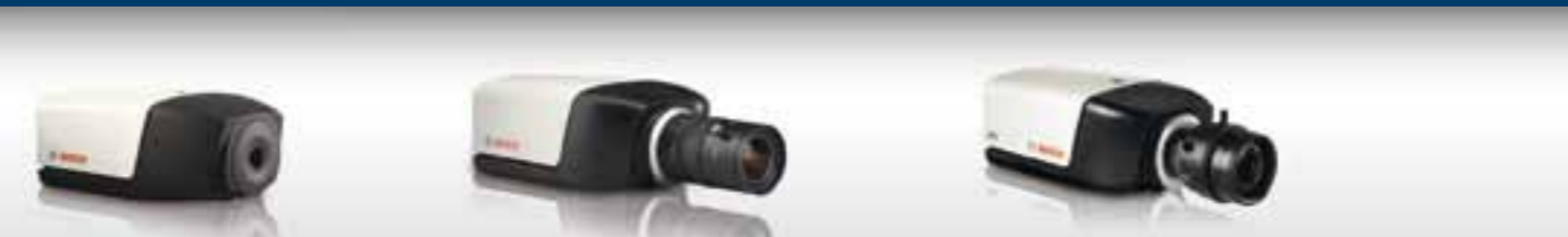
Câmera IP NBC-225-P Lente fixa VGA de 4,9 mm, F2.8, PoE, 12 Vcc 1A