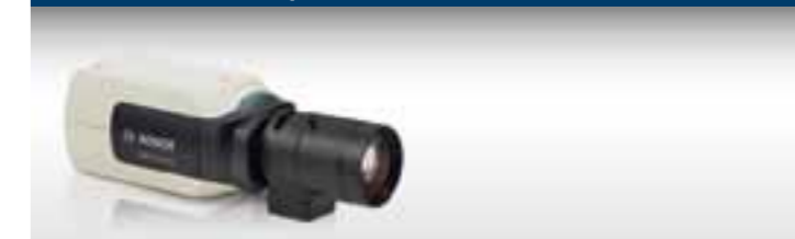
Câmera Dia/Noite VBC-265-11 540 TVL, D/N, 12 Vcc / 24 Vca